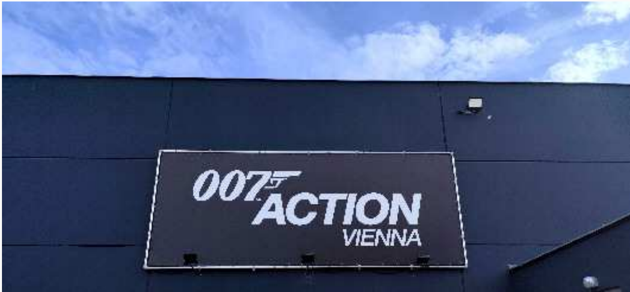
007 Action

Wien [ENA] Die offizielle James-Bond-Ausstellung "007 Action" begeistert auf 3400qm Ausstellungsfläche und mit über 100 Unikaten aus den James Bond Filmen noch bis zum 27.10.2024 im Kulturzentrum MetaStadt in Wien die großen und kleinen Fans vom beliebtesten Geheimagenten unserer Zeit, James Bond 007.