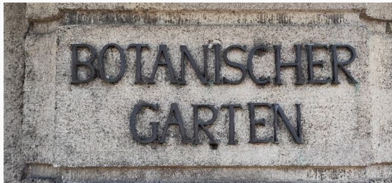
Botanischer Garten

München [ENA] Der Botanische Garten in München-Nymphenburg ist nicht nur für auswärtige Besucher immer wieder ein besonderes Highlight, sondern er bietet durch sein ständig wechselndes Programm auch für in München ansässige einen Anreiz hier regelmässig vorbei zu schauen.