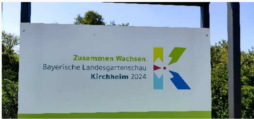
LGS 2024

Kirchheim [ENA] Unter dem Motto "Zusammen.Wachsen" findet seit dem 15.05.2024 und noch bis zum 06.10.2024 die Bayerische Landesgartenschau in Kirchheim bei München statt, zu der man hier durch Einbringung von Wünsche und Ideen der Bürger und Bürgerinnen einen neuen Ortspark geschaffen hat.