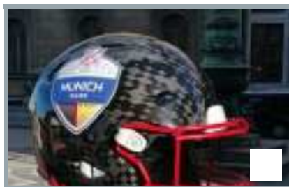
Munich Game Helm

Die Innenstadt selbst zeigt auch, dass hier nun ein besonderes Ereignis bevor steht und so sieht man überall Flaggen und das NFL Logo. In vielen Lokalen gibt es ab Freitag Abend NFL Parties und einige der Lokale sind sogar zum sogenannten Headquarter für die einzelnen Mannschaften geworden. Die Seattle Seahawks finden wir im Augustiner Stammhaus in der Neuhauser Straße und die Tampa Bay Buccaneers haben sich ins Hofbräuhaus am Platzl begeben. Selbst Aloisius (Der Münchner im Himmel) hat sich ein Bucks Jersey übergestreift und singt am Sonntag wohl nicht Hallelujah sondern eher Go Bucs.