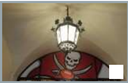
Hofbräuhaus im NFL Fieber