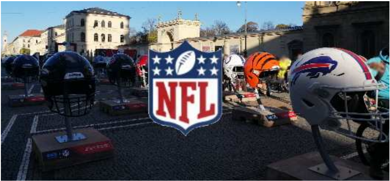
NFL Helme am Odeonsplatz

München [ENA] Die beiden NFL Mannschaften sind nun in München angekommen und die Seattle Seahawks haben heute Nachmittag das erste Training begonnen. Die Tampa Bay Buccaneers trainieren dann morgen Nachmittag am FC Bayern Campus in Freimann. Die Öffentlichkeit ist jedoch vom Training ausgeschlossen.